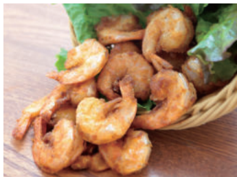
ガーリックシュリンプ ¥650