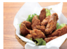
フライドチキンウイング ¥650