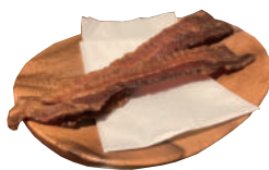
特製カリカリベーコン ¥550